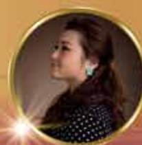
青年女高音歌唱家 謝謝 Soprano Xie Xie