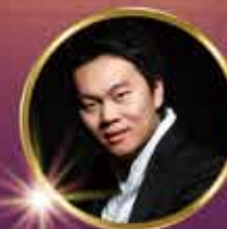
青年男中音歌唱家 朱振濤 Baritone Zhu Zhentao