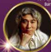
著名指揮家 呂曉一 Conductor Lu Xiaoyi